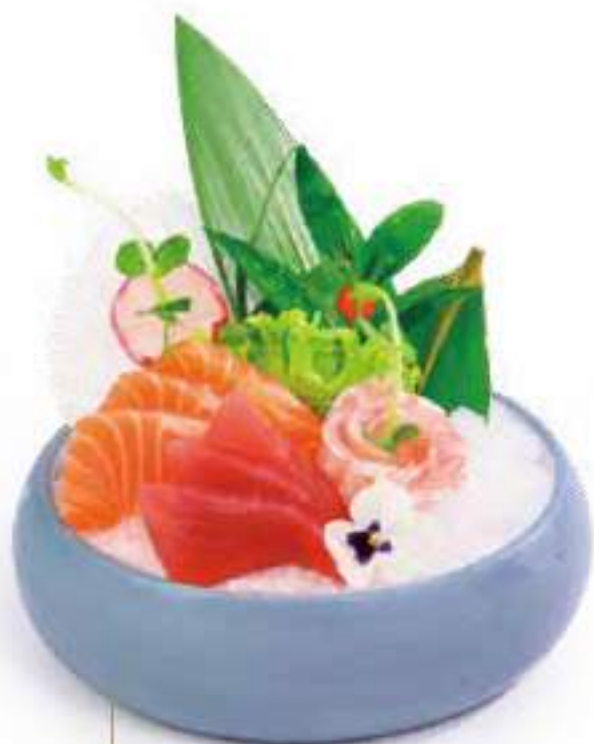
162 SASHIMI MIX 8PZ sashimi misto €12.00 Ⓢ