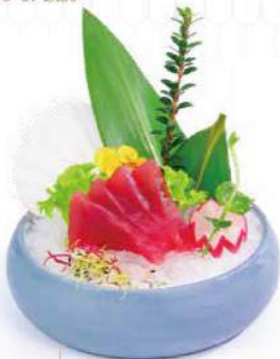
161 SASHIMI MAGURO 8PZ Sashimi di tonno €12.00 Ⓢ