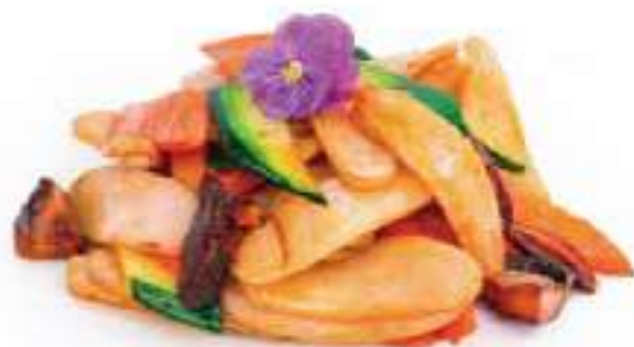
254 | YASAI GNOCCHI 🌱 gnocchi saltati con verdure e funghi €6.00 🌱