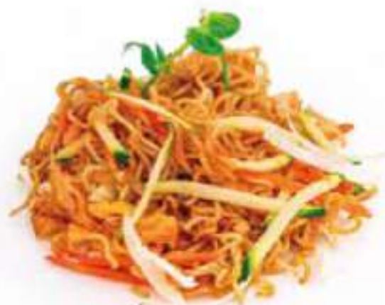
262 | YAKI RAMEN YASAI 🌱 pasta ramen saltato con uova e verdure €6.00 🌱🌱