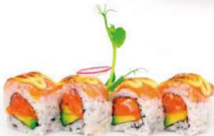
222 | PHOENIX ROLL 8PZ tartare di salmone piccante, avocado, tobiko*, carpaccio di salmone scottato all'esterno, salsa inari €12.00 🍣🍣🍣🍣