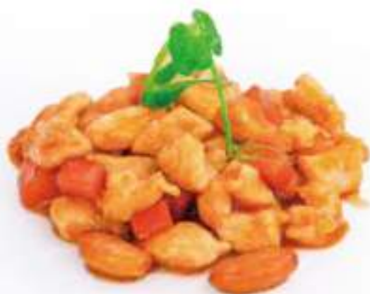
302 | POLLO ALLE MANDORLE €8.00 🌱