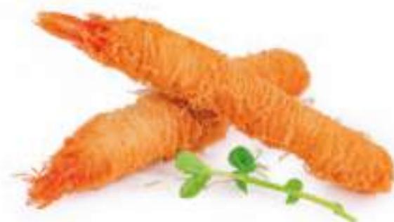
50 | EBI NIDO 4PZ gamberi* avvolti in pasta kataifi €12.00 🍴🍴