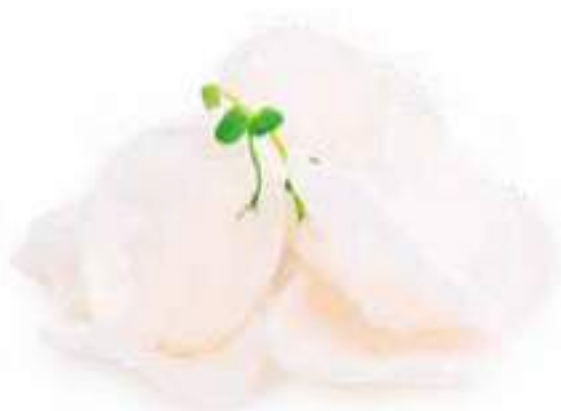
55 | NUVOLETTE DI DRAGO farina di tapioca e gamberi* €3.00 🌱