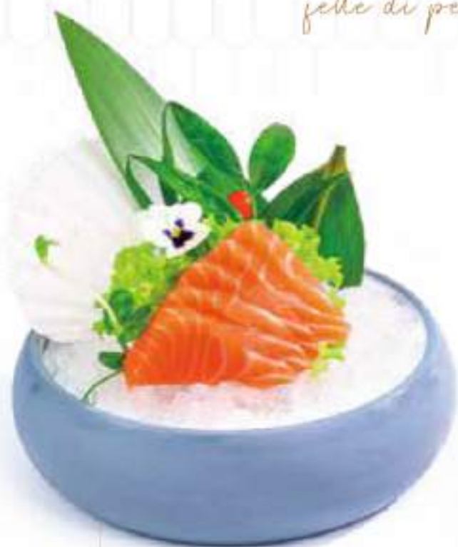
160 SASHIMI SAKE 10PZ sashimi di salmone €10.00 Ⓢ