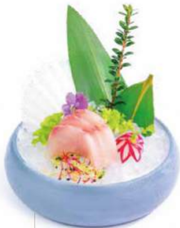
163 SASHIMI RICCIOLA* 5PZ €7.00 Ⓢ