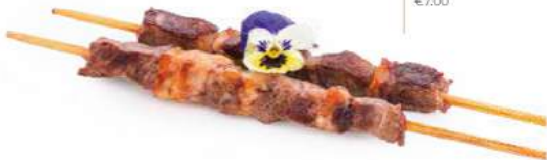
311 | KOHITSUJI TEPPANYAKI 4PZ Spiedini di agnello alla piastra con olio d'oliva €7.00