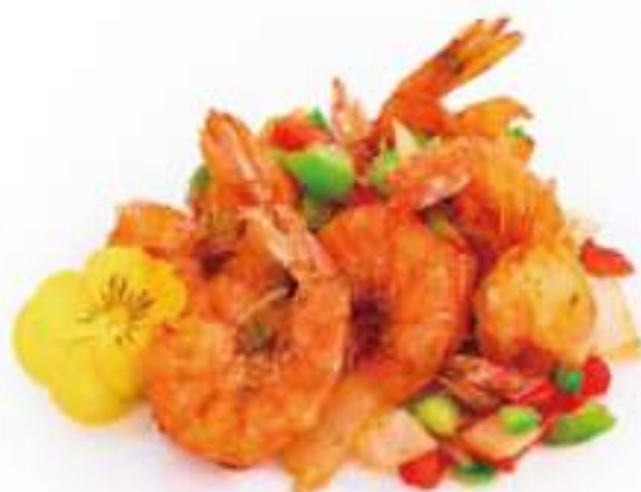
288 | GAMBERI SALE E PEPE gamberi saltati con sale e pepe, peperoni, cipolle €8.00 ②