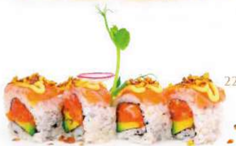
226 | BRIGHT STAR 8PZ tartare di salmone piccante, avocado, tobiko*, carpaccio di salmone scottato e granella di pistacchio all'esterno, salsa inari €12.00 🍴🍴🍴🍴