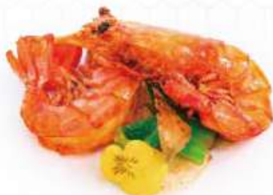
286 | GAMBERONI IN SALE E PEPE 4PZ €10.00 ②