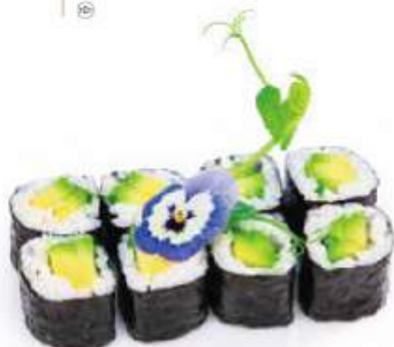
188 | HOSO AVOCADO Ⓢ avocado €4.50