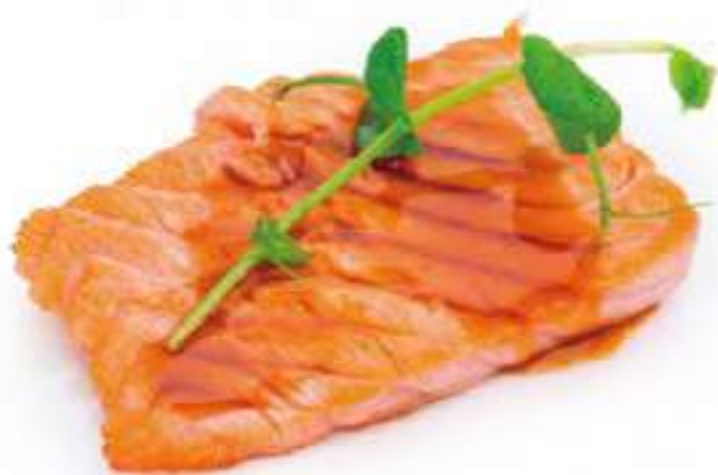
317 | SAKE TEPPANYAKI 2PZ filetto di salmone alla piastra con salsa teriyaki €8.00 ①②③