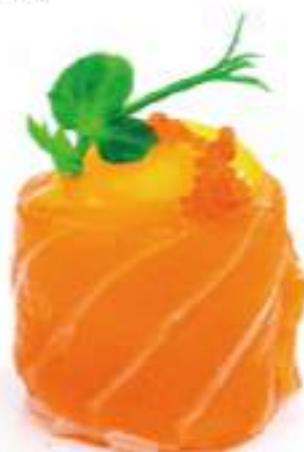
129 | GUNKAN SPHERE 2PZ uova di quaglia e tobiko, avvolte con il salmone all'esterno €6.00 🍱🌱🍷