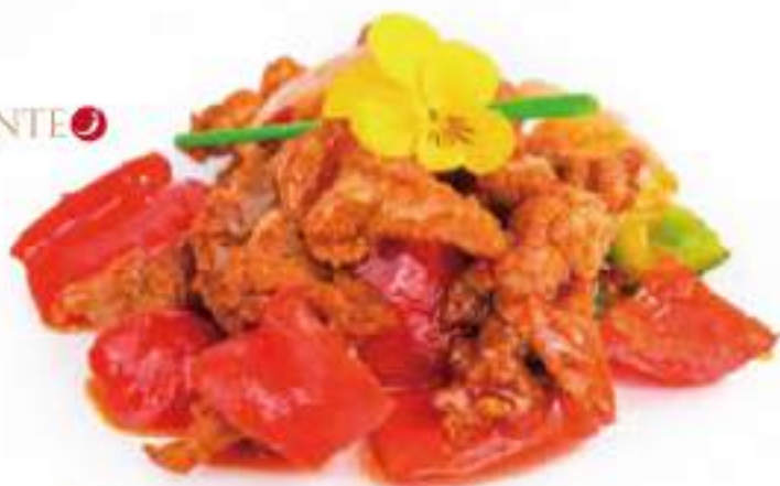
294 | MANZO IN SALSA PICCANTE ② manzo saltato con peperone e salsa piccante €8.00 ①