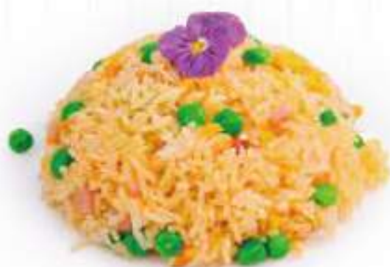
251 | RISO CANTONESE riso saltato con prosciutto, uova e piselli €7.00 🌱🌱