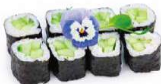
189 | HOSO KAPPA Ⓢ cetriolo €4.50