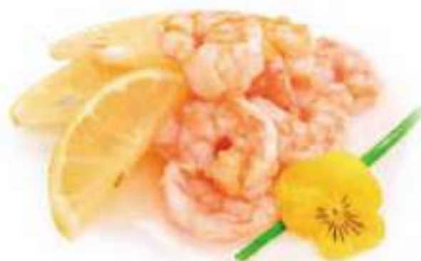
290 | GAMBERI* IN SALSA AL LIMONE €8.00 ①②