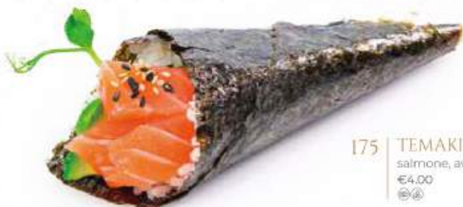
175 | TEMAKI SAKE salmone, avocado €4,00 🌱🌱