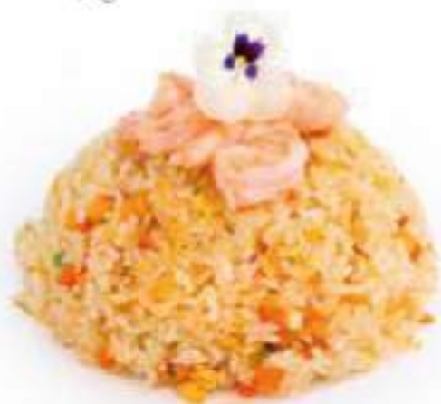
252 | EBI MESHI riso saltato con gamberi*, uova e verdure €7.00 🌱🌱