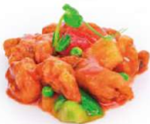
303 | POLLO IN SALSA AGRODOLCE €8.00 🌱