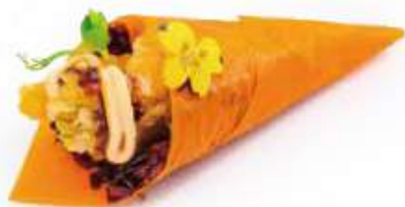
179 | TEMAKI ECLIPSE riso venere con fiori di zucca in tempura, salsa cocktail e salsa teriyaki, avvolto in sfoglia di soia €4,50 🌱🌱🌱🌱