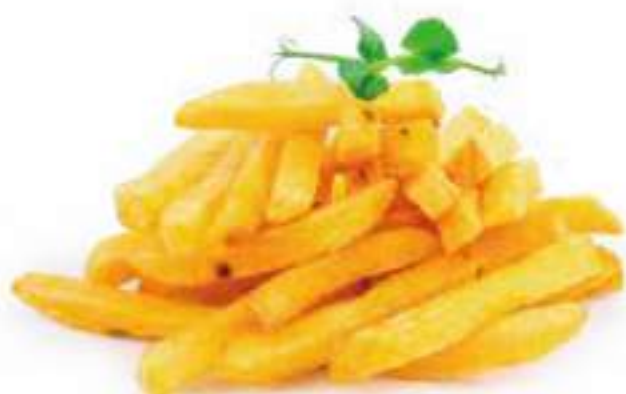
56 | PATATINE FRITTE* 🌱 €4.00 🌱