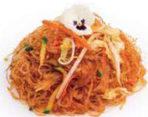
264 | YAKI SOIA YASAI 🌱 spaghetti di soia saltati con verdure miste €6.00 🌱