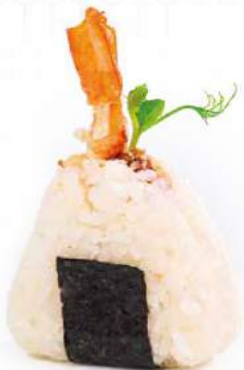
245 | ONIGIRI EBITEN polpette di riso con gamberi fritti, maionese, salsa teriyaki €4.00 🌱🌱🌱