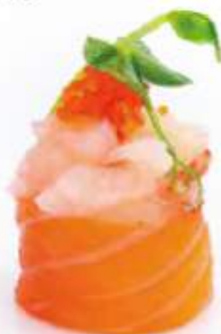
131 | GUNKAN INARI 2PZ tartare di gambero crudo*, e tobiko*, avvolte con il salmone all'esterno €5.00 🍱🌱🍷