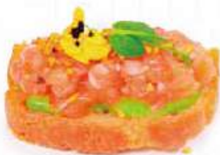
52 | CASSIOPEIA 2PZ fetta dorata con tartare di salmone, granella di pistacchio e crema al pistacchio €6.00 🌱🌱🌱🌱