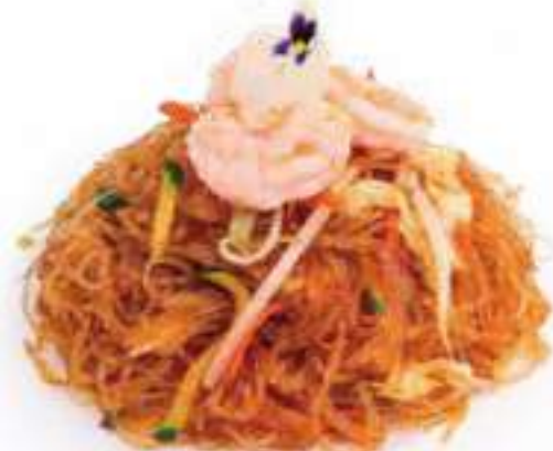
265 | YAKI SOIA EBI spaghetti di soia saltati con gamberi*, verdure €8.00 🌱🌱