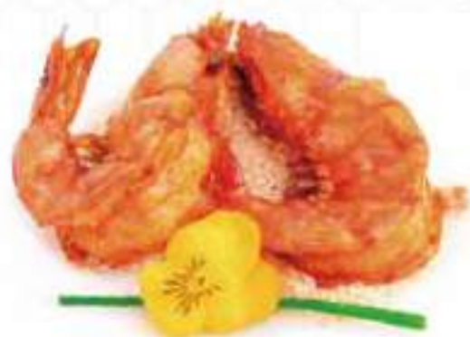
285 | OSAKA 4PZ gamberoni* croccanti con panko e aglio €10.00 ①②