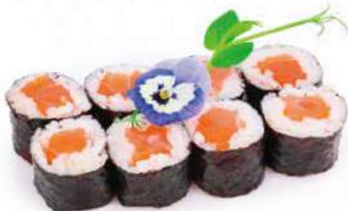
185 | HOSO SAKE salmone €5.00 Ⓢ