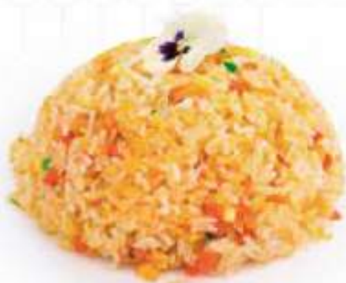
250 | YASAI MESHI 🌱 riso saltato con uova e verdure €6.00 🌱