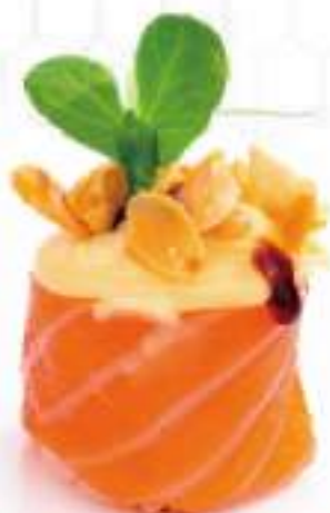
126 | GUNKAN DIAMOND 2PZ mandorle scaglie, sopra la salsa inari, avvolte con il salmone all'esterno €5.00 🍱🌱🌿🍷