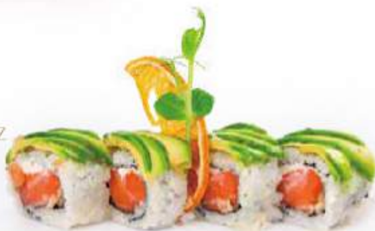
223 | CATERPILLAR ROLL 8PZ salmone, pasta tempura, philadelphia, avocado all'esterno, salsa teriyaki €11.00 🍣🍣🍣🍣