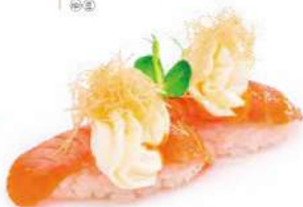
108 | SAKE FLAMBÉ HONEY salmone scottato, con philadelphia, pasta kataifi e salsa al miele €4.00 🍴🍴