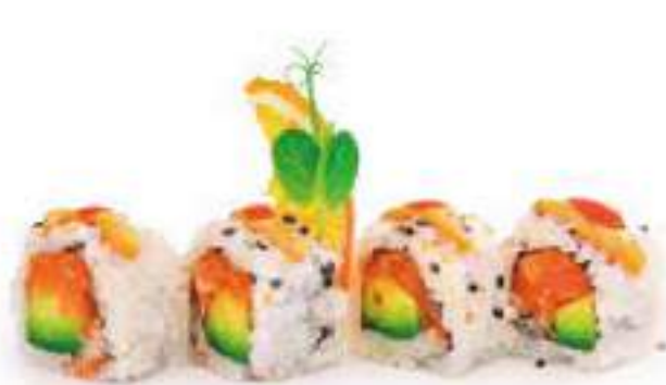
208 | URAMAKI SPICY SAKE 8PZ 🌶️ tartare di salmone piccante, tobiko*, avocado, salsa maionese piccante €9.00 🌱🌱🌱