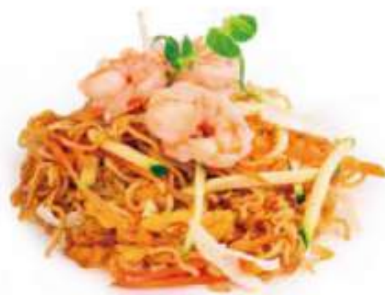
263 | YAKI RAMEN EBI pasta ramen saltato con gamberi*, uova, verdure €8.00 🌱🌱🌱