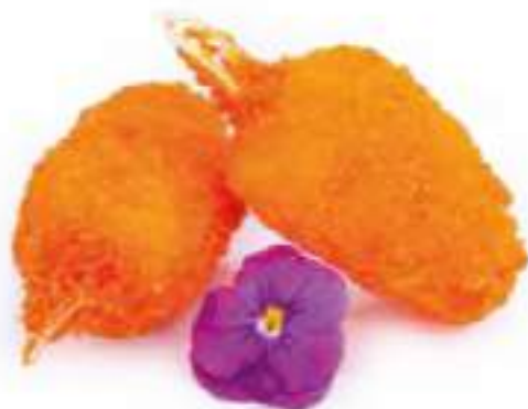
49 | CHELE DI GRANCHIO* 4PZ polpa di granchio fritta €5.00 🍴🍴