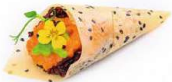
178 | TEMAKI SPECIALE riso venere con spicy salmone, crema alla rucola, pistacchio, avvolto in sfoglia di soia ai semi di sesamo €4,50 🌱🌱🌱🌱🌱