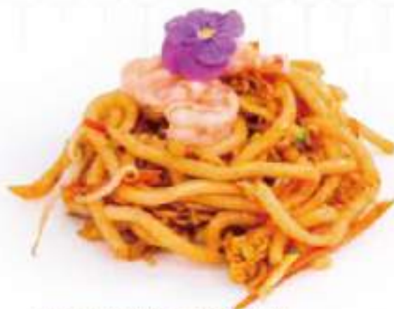
261 | YAKI UDON EBI pasta udon saltato con gamberi*, uova, verdure €8.00 🌱🌱🌱