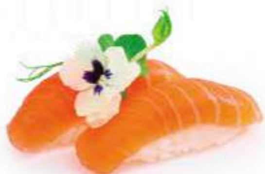
94 | NIGIRI SAKE salmone €3.00 Ⓢ