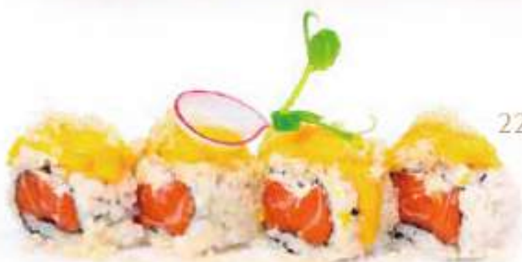
225 | MANGO MADNESS 8PZ tartare di salmone, philadelphia, mango e pasta tempura all'esterno, salsa al mango €12.00 🍴🍴🍴🍴