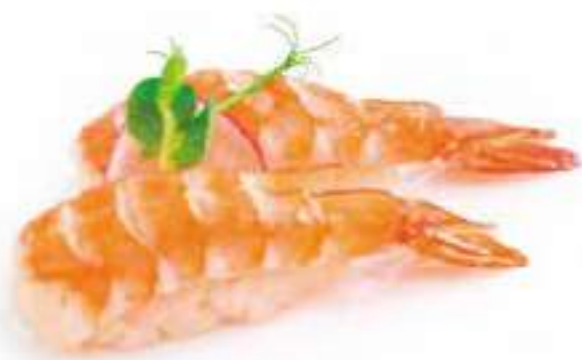
97 | NIGIRI EBI gambero cotto €3.50 Ⓢ