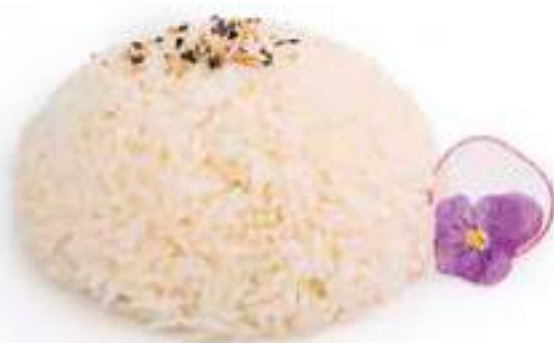
253 | WHITE MESHI 🌱 riso bianco al vapore con sesamo €3.00 🌱