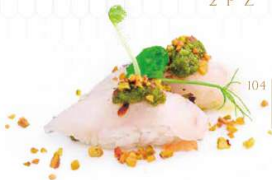
104 | SUZUKI NUT branzino, granella di pistacchio, con salsa al pesto €3.50 🍴🍴