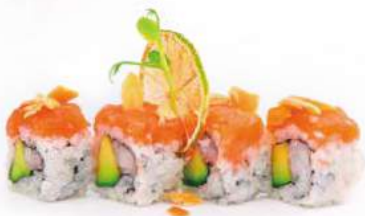
221 | HACHIKO MAKI 8PZ gambero crudo*, avocado, tartare di salmone e scaglie di mandorle all'esterno, salsa teriyaki €12.00 🍣🍣🍣🍣