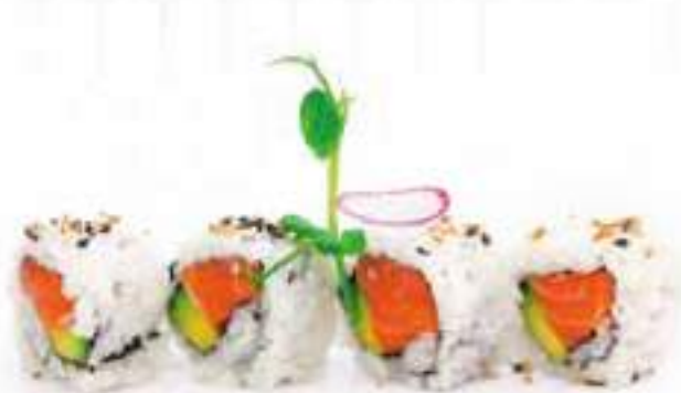
205 | URAMAKI SAKE 8PZ salmone, avocado €8.00 🌱🌱