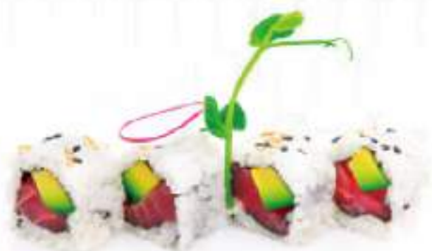
206 | URAMAKI MAGURO 8PZ tonno, avocado €9.00 🌱🌱