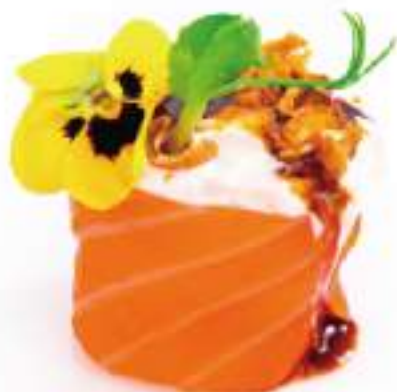
128 | GUNKAN BURRATA 2PZ burrata e cipolla fritto avvolte con il salmone all'esterno con salsa teriyaki €5.00 🍱🌱🍷