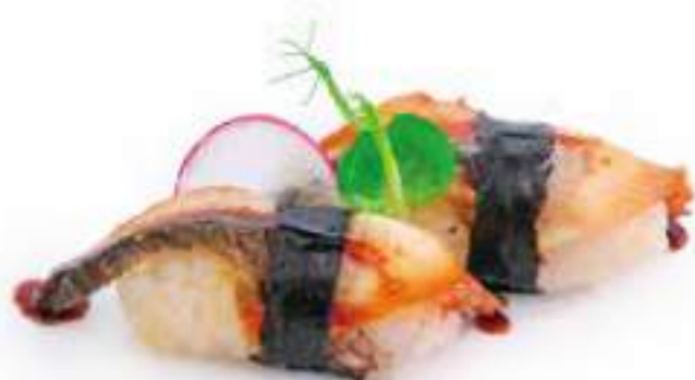
103 | NIGIRI UNAGI anguilla* €4.00 🌱