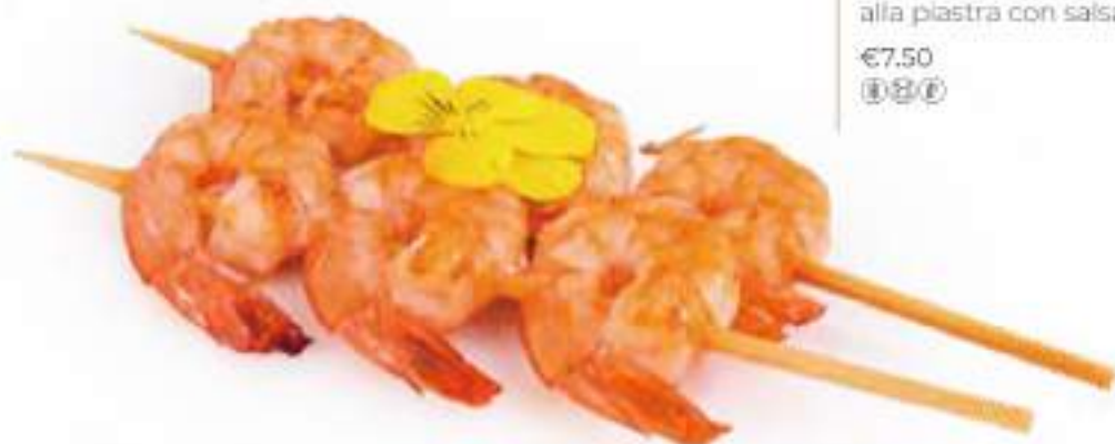
312 | EBI TEPPANYAKI 4PZ spiedini di gamberi* alla piastra con salsa teriyaki €7.50 ①②③