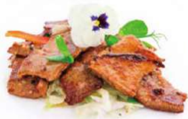
293 | MANZO YAKINIKU manzo saltato con salsa yakiniku, insalata €9.00 ①