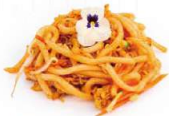
260 | YAKI UDON YASAI 🌱 pasta udon saltato con uova e verdure €6.00 🌱🌱