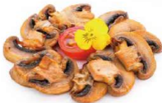
319 | YAKI KINOKO ② funghi alla piastra €7.00