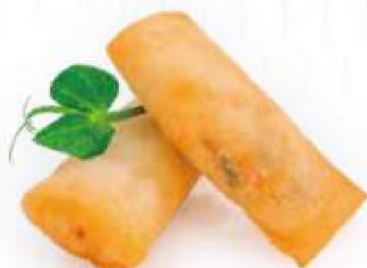
46 | INVOLTINI PRIMAVERA 4PZ @ croccante sfoglia di grano con ripieno di verdure €3.50 🍴