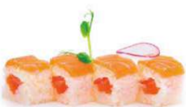
210 | SALMONE ROLL 8PZ salmone, philadelphia con salmone all'esterno €12.00 🌱🌱