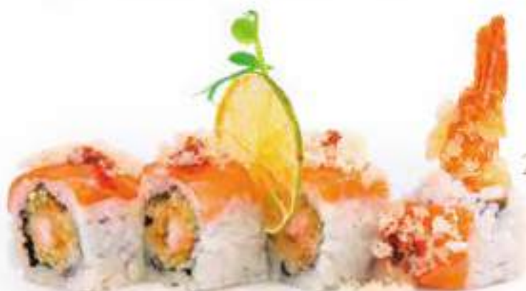
227 | TIGER ROLL 8PZ gambero* in tempura al maionese, carpaccio di salmone all'esterno, pasta tempura, salsa teriyaki €12.00 🍴🍴🍴🍴