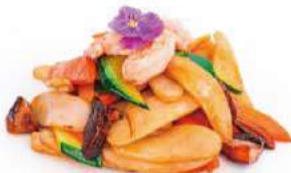
255 | EBI GNOCCHI gnocchi saltati con verdure e funghi, gamberi €8.00 🌱🌱