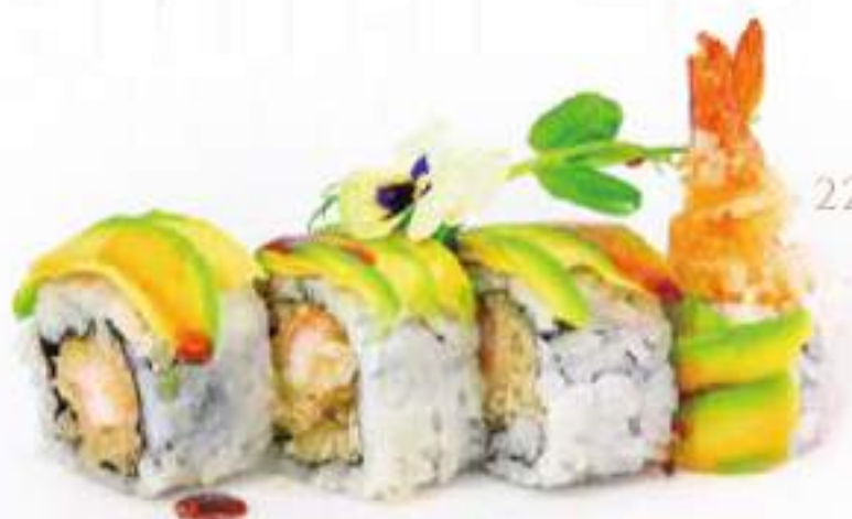
220 | GREEN DRAGON 8PZ gambero* in tempura, maionese, avocado all'esterno, salsa teriyaki €12.00 🍣🍣🍣🍣