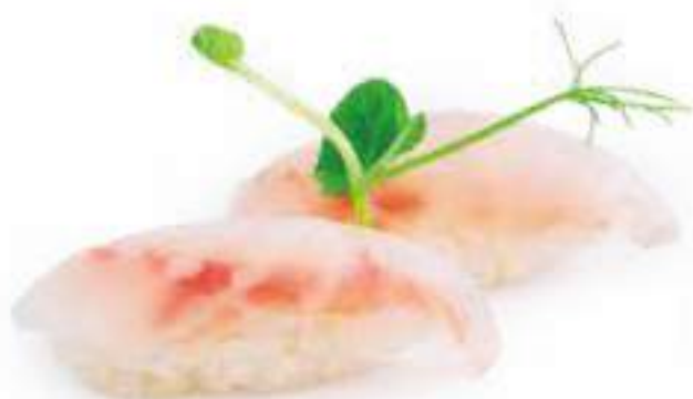
96 | NIGIRI SUZUKI branzino €3.00 Ⓢ