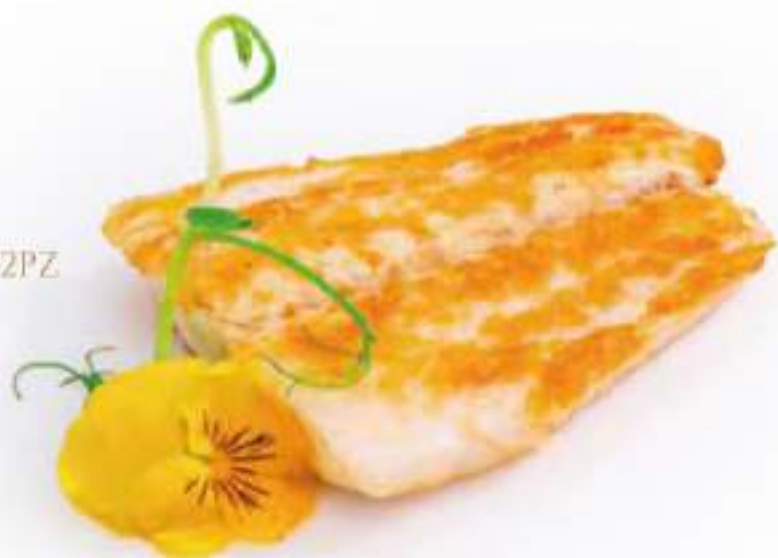
318 | SUZUKI TEPPANYAKI 2PZ filetto di branzino alla piastra con salsa teriyaki €9.00 ①②③