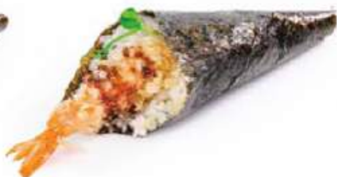
177 | TEMAKI TEMPURA gambero* in tempura, maionese, salsa teriyaki €4,00 🌱🌱🌱