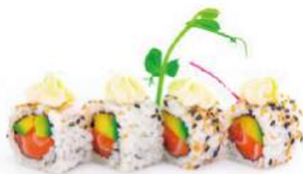
207 | URAMAKI PHILADELPHIA 8PZ salmone, avocado, philadelphia €9.00 🌱🌱🌱