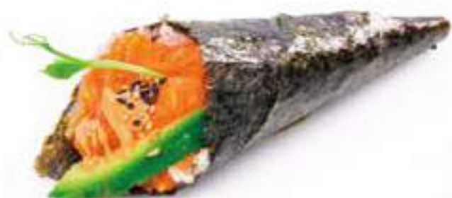
176 | TEMAKI SPICY SAKE 🌶️ tartare di salmone piccante, tobiko*, avocado, salsa maionese piccante €4,00 🌱🌱🌱