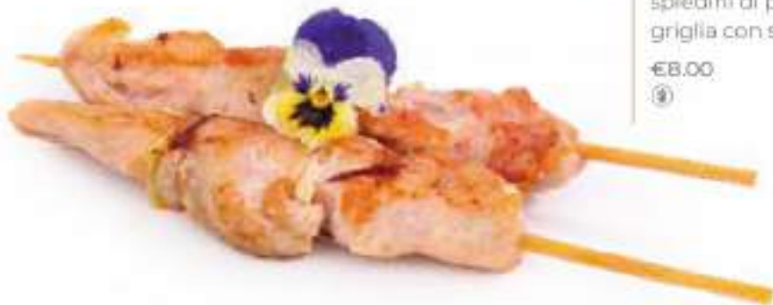
310 | YAKI TORI 4PZ spiedini di pollo alla griglia con salsa teriyaki €8.00 ①