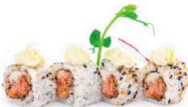
209 | URAMAKI MIURA 8PZ salmone grigliato condito con philadelphia, salsa teriyaki, pasta tempura €8.00 🌱🌱🌱🌱