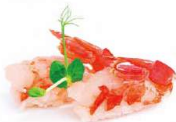
102 | NIGIRI AMAEBI Cambero crudo* €4.00 🌱