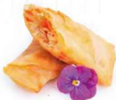
45 | EBI HARUMAKI 2PZ involtino giapponese con gamberi* e verdure €5.00 🍴🍴