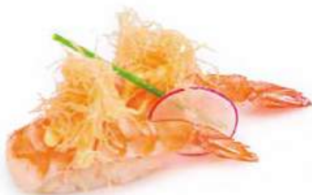
107 | EBI LIGHT gambero cotto*, con la pasta kataifi, con salsa zafferano €4.00 🍴🍴