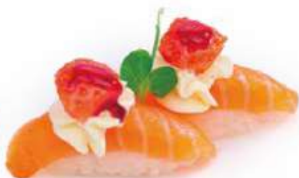
106 | SAKE ICHIGO salmone con fragola, e salsa al frutti di bosco, philadelphia €3.50 🍴🍴