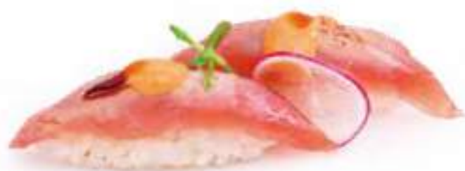
101 | SPICY FLAMBÉ MAGURO 🍷 tonno scottato, con salsa teriyaki e maionese piccante €4.00 🌱🌶️🍷