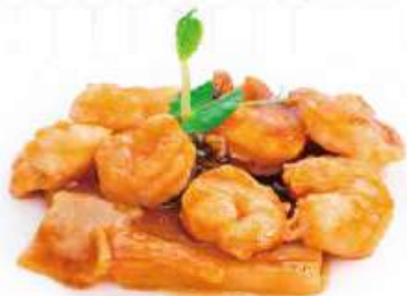
291 | GAMBERI* CON FUNGHI E BAMBÙ €8.00 ①②