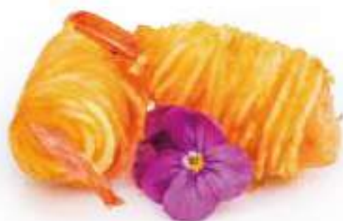
48 | EBI FURAI 4PZ gamberi* avvolti in pasta di patate €6.00 🍴🍴