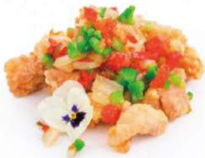
300 | POLLO AL SALE E PEPE pollo fritto con sale e pepe €8.00 🌱