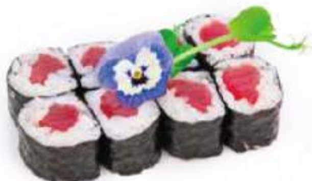
186 | HOSO MAGURO tonno €6.00 Ⓢ