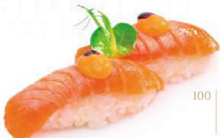
100 | SPICY FLAMBÉ SAKE 🍷 salmone scottato, con salsa teriyaki e maionese piccante €3.50 🌱🌶️🍷