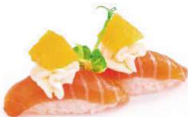
105 | SAKE ORANGE salmone alla arancia e philadelphia €3.50 🍴🍴