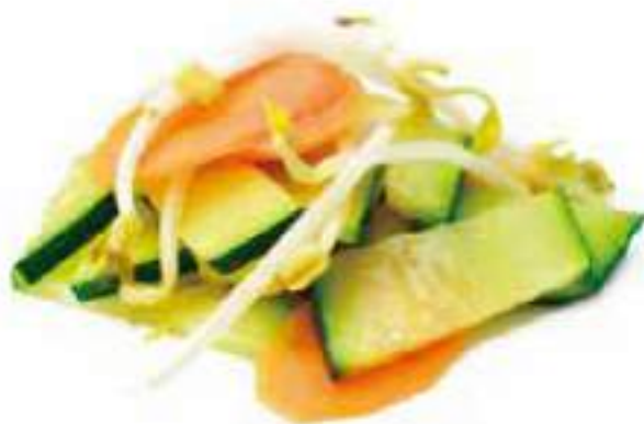
304 | YASAI ITAME 🌱 verdure miste saltate €5.00 🌱