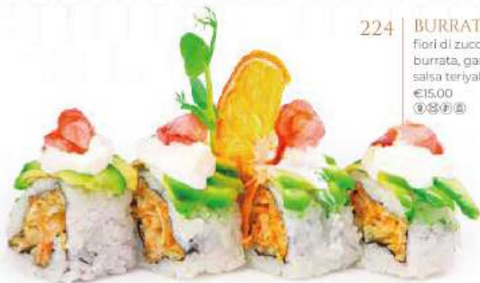
224 | BURRATA ROLL 8PZ fiori di zucca fritta, con avocado, burrata, gamberi rossi all'esterno, salsa teriyaki €15.00 🍴🍴🍴🍴