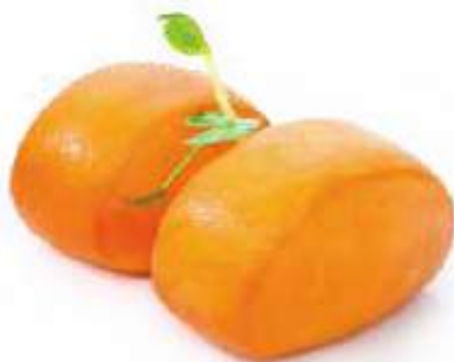
54 | MANTOU FRITTO 3PZ 🌱 pane orientale fritti €5.00 🌱