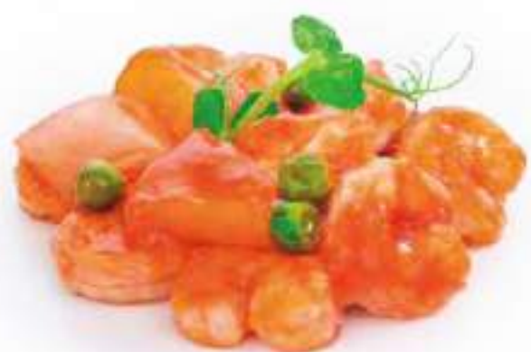
292 | GAMBERI* IN SALSA AGRODOLCE €8.00 ①②