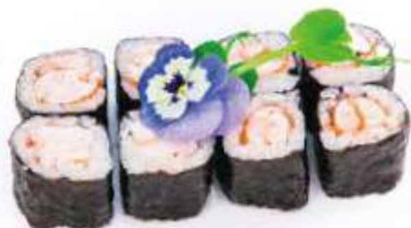
187 | HOSO EBI gambero cotto* €5.00 Ⓢ