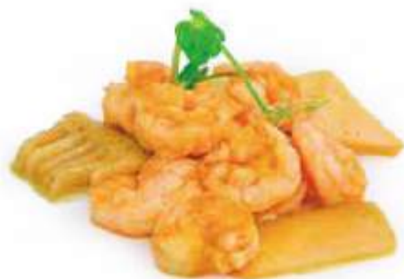
287 | GAMBERI AL CURRY gamberi saltati con bambu e salsa curry €8.00 ①②