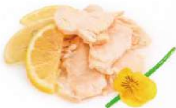
301 | POLLO AL LIMONE €8.00 🌱