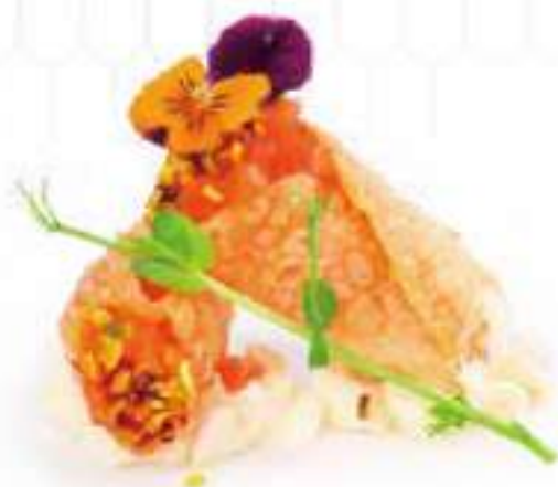
51 | SAKE CANNOLI 2PZ cannoli di salmone con pistacchio, philadelphia e salsa teriyaki €6.00 🌱🌱🌱🌱