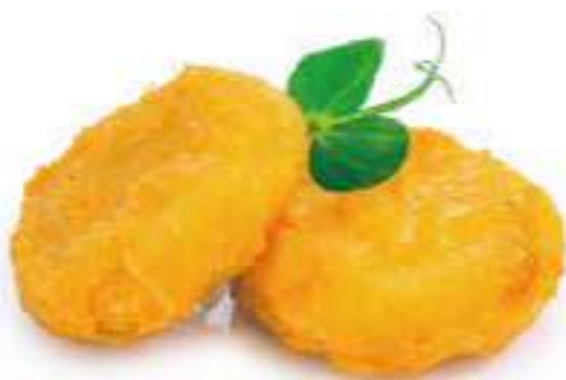
53 | NUGGETS FRITTO 4PZ €5.00 🌱