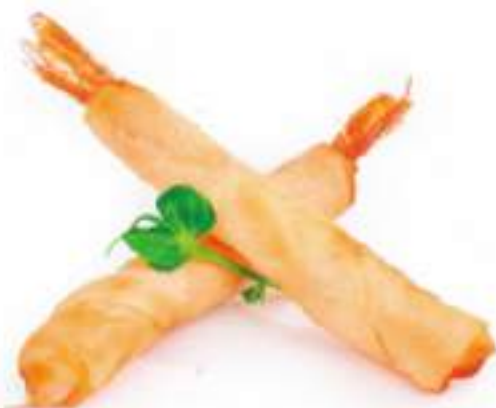
47 | SAMURAI STICK 4PZ involtini di gamberi* €6.00 🍴🍴