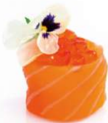
130 | GUNKAN IKURA 2PZ uova di salmone*, avvolte con il salmone all'esterno €5.50 🍱