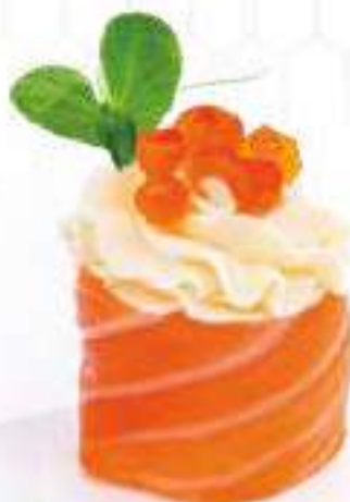
127 | GUNKAN PHILA IKURA 2PZ uova di salmone*, philadelphia, avvolte con il salmone all'esterno €5.50 🍱🌱🍷